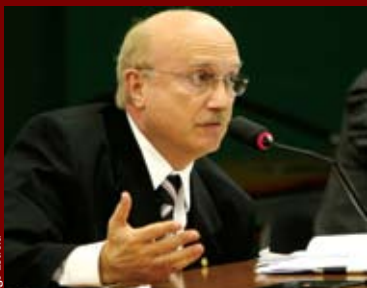
Deputado Osmar Serraglio

A gentes públicos que enriqueceram de forma ilícita no exercício de mandato, cargo, emprego ou função na administração pública direta, indireta ou nas fundações poderão sofrer penas por ato de improbidade de forma separada, e não somente de modo cumulativo ou em bloco. A aplicação das punições ocorrerá mesmo que não tenha havido dano ao patrimônio público. A proposta é do deputado Osmar Serraglio (PR) , que altera a Lei de Improbidade Administrativa.